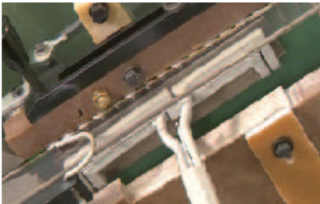
Chauffe de vis avant roulage