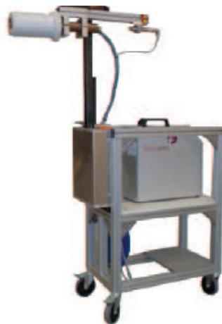
Ensemble de freinage module moteur