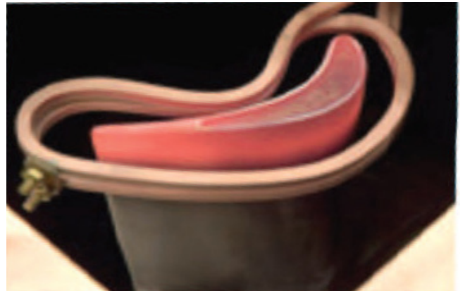
Chauffe d'ailette avant rechargement