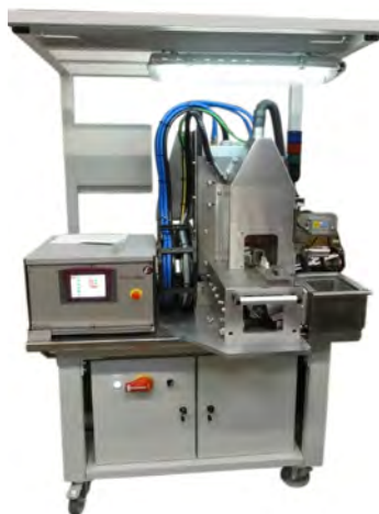
Brasage par induction de contacts électriques sur machine semi-automatique