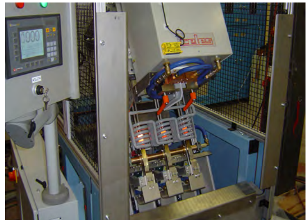
Chauffage de lopins avant matriçage sur machine automatisée