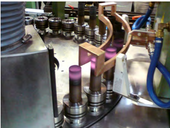
Recuit de douilles haute cadence sur machine automatisée à carrousel