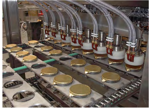
Thermoscellage par induction