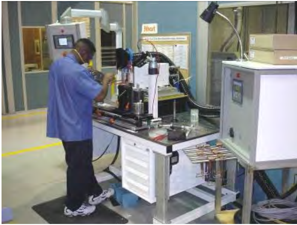
Brasage d'inserts carbure en mode semi-automatique

Spécialisée depuis 1967 dans l'électrothermie par induction, Fives Celes développe, fabrique et met au point des inducteurs aux caractéristiques spécifiques pour répondre aux besoins de ses clients.